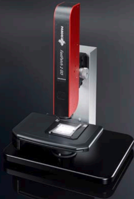
Automatisches Bildanalyse-System PAMAS FastPatch 2 GO für die Membranfilteranalyse