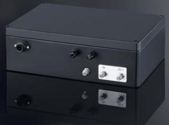
Online-Partikelzähler PAMAS S50DP mit integriertem Verdünnungssystem