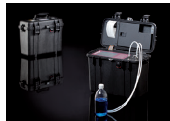
Robustes Gehäuse PAMAS GO

Alle Modellvarianten sind optional im robusten Gehäuse PAMAS GO erhältlich.