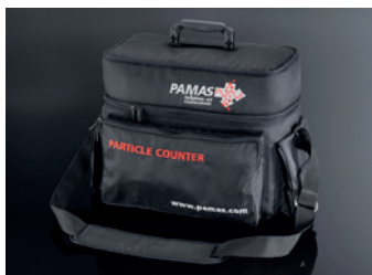
Bolsa de ombro PAMAS GO

A bolsa de ombro com ajuste personalizado oferece espaço extra para acessórios.